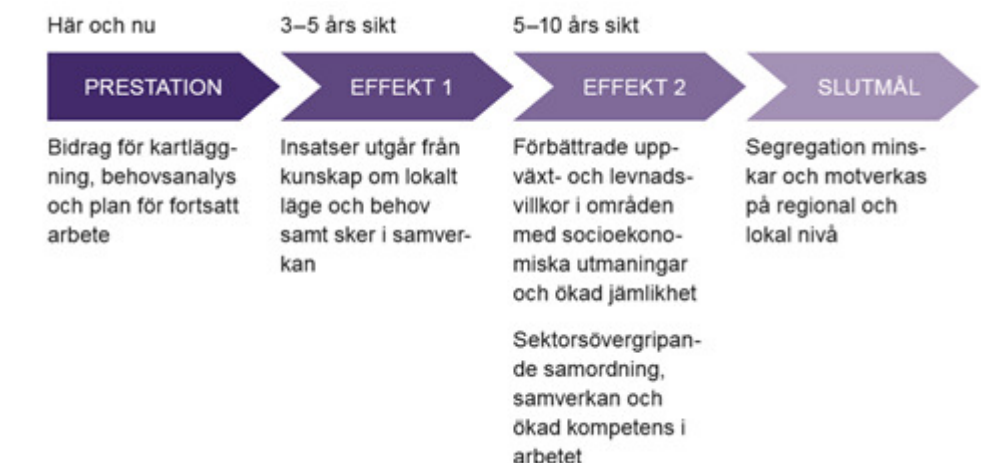
Figur 2. Bidragslogik 2018

Myndighetens intention var att aktörernas arbete i det tredje steget, genomförandet av långsiktiga åtgärder mot segregation (effekt 1), skulle utgå från insikter ifrån kartläggningen av nuläget och analysen av behov (prestation). Det var samtidigt inte myndighetens förväntan att aktörer skulle vara helt framme vid ett konkret genomförande av åtgärder i samverkan under 2018, eftersom arbetet enbart just hade startat för flera aktörer. Myndigheten prioriterade ansökningar i det tredje steget som bedömdes fokusera på långsiktighet.