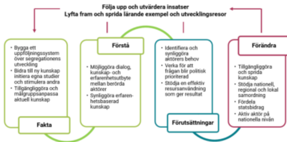
Figur 3. Myndighetens insatsområden i arbetet med att minska och motverka segregation

Denna kunskap om och förståelse för segregation är en grund för att aktörerna utifrån sina förutsättningar ska kunna agera för en utveckling som minskar platsens betydelse och därmed minskar segregationen . När aktörernas kunskap och förståelse har ökat kan myndigheten succesivt växla upp sitt arbete till att i större utsträckning fokusera på steg tre och fyra (att skapa förutsättningar och förändring hos aktörerna).