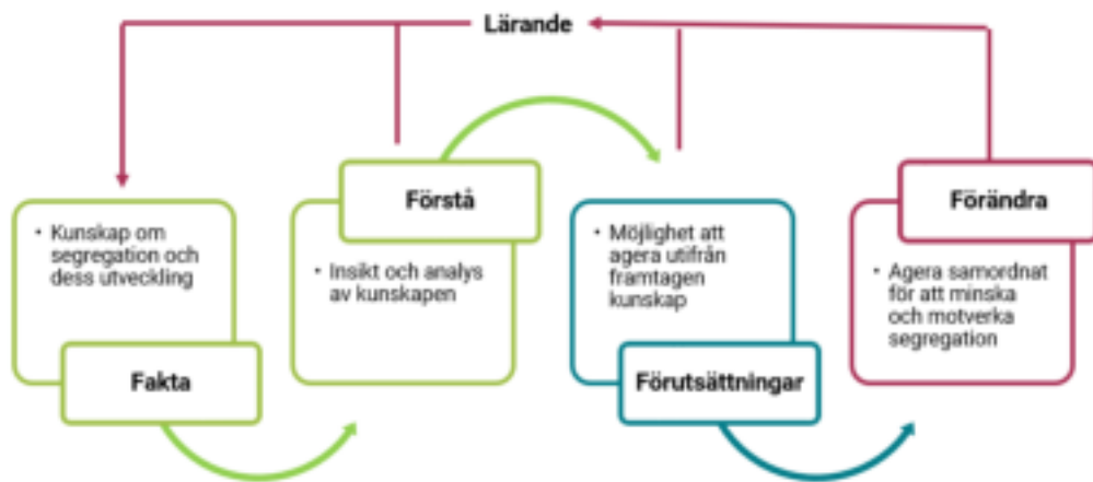
Figur 2. Utveckling i förändringsarbetet

Även om det finns en förståelse av hur kunskapen kan användas i det praktiska arbetet är det inte säkert att det sker. Det krävs att det finns förutsättningar som exempelvis resurser, prioriteringar och strävan mot gemensamma mål, för att göra det möjligt att agera utifrån den bästa tillgängliga kunskapen. När aktörerna använder kunskapen på ett ändamålsenligt sätt så besitter de en viss handlingsförmåga. För att skapa verklig förändring behövs ett samordnat agerande (handlingsförmåga) för att minska och motverka segregation. För att skapa ett lärande behöver också agerandet och genomförandet följas upp.